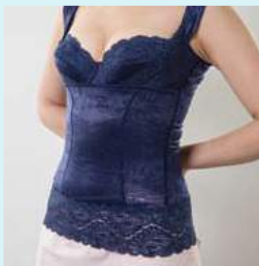
バストアップシェイプキャミソール サイズ S~LL