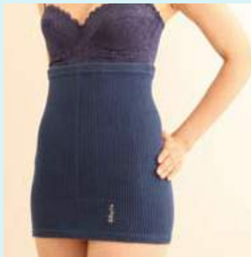
ウエストサポーター サイズ M・L