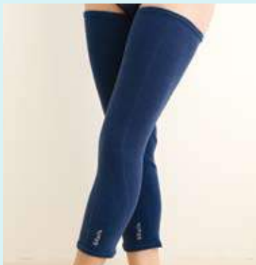
ロングサポーター サイズ M・L