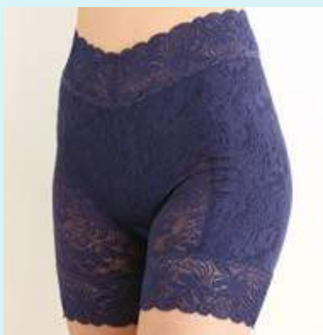
ロングガードル サイズ 58~82