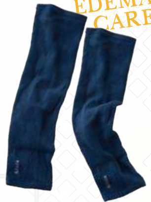
ロングサポーター

サイズ M・L ¥21,000 (税別) 25%OFF 通常価格 ¥28,000