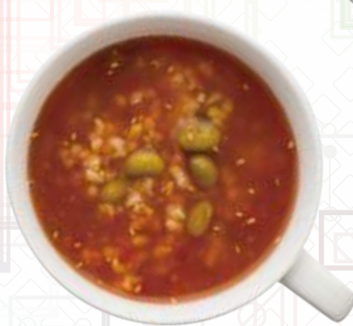
チキンのトマト煮粥