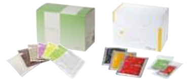
&Ratia ダイエットシリーズ (2種から選択)

システムダイエット7・セルフコントロールダイエット ※どちらか1品のみお選び頂けます