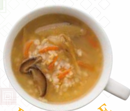
根菜のきんぴら風粥