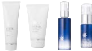
artia4点セット (ローションのみ2種から選択)