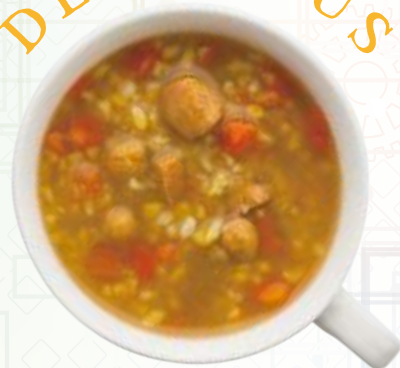
ひよこ豆とチキンの カレー風粥