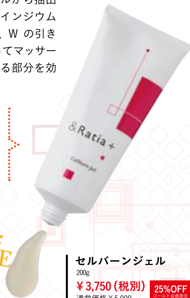
セルバーンジェル 200g