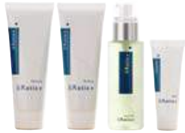
&Ratia 基礎1ヶ月4点セット